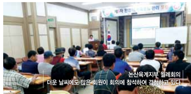
논산육계지부 월례회의의 더운 날씨에도 많은 회원이 회의에 참석하여 경청하고 있다