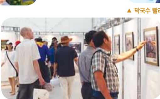
▲ 춘천 미공개 사진전을 관람하는 방문객들