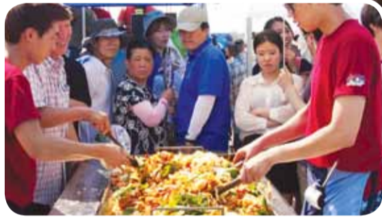
▲ '100인분 닭갈비 무료시식' 행사 모습