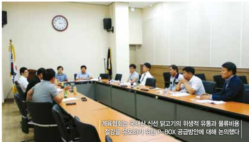
계육협회는 국내산 신선 닭고기의 위생적 유통과 물류비용 절감을 유도하기 위한 P-BOX 공급방안에 대해 논의했다