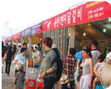
▲ 닭갈비 판매부스를 찾는 방문객들