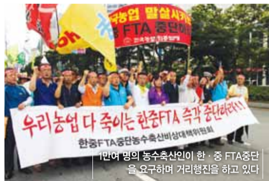
1만여 명의 농수축산인이 한·중 FTA 중단을 요구하며 거리행진을 하고 있다