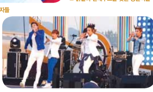
▲ KBS 특별공연을 펼치고 있는 아이돌그룹 'EXCITE'