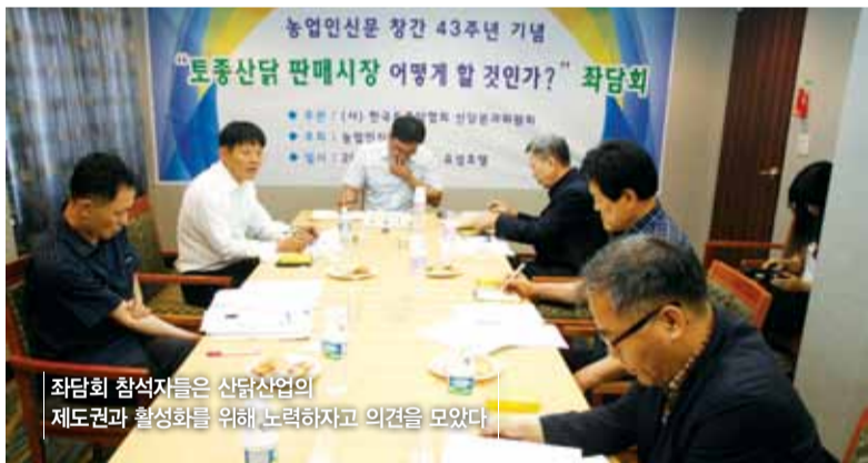
좌담회 참석자들은 산닭산업의 제도권과 활성화를 위해 노력하자고 의견을 모았다