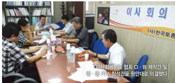
이사회에서는 협회 CI·BI 제작건 및 한·중 FTA 참석건을 원안대로 의결했다